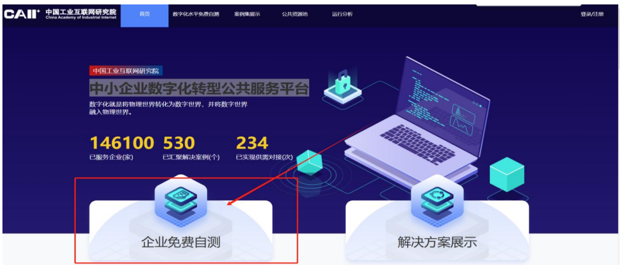
图10 数字化水平评测界面

(3) 企业概况：系统会同步企业的基础信息，企业需在中小企业数字化转型公共服务平台 ( http://caii-sme.indusforce.com )，进行企业数字化水平等级测评（数字化水平测评等级为必选项）。