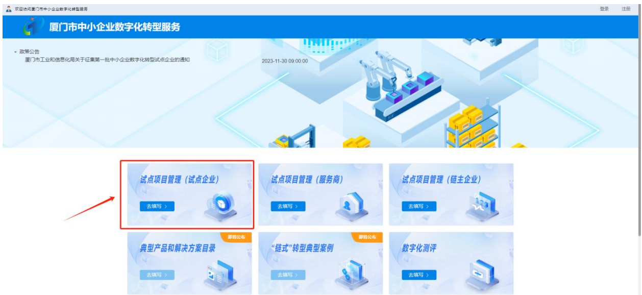
图6 试点企业申报入口