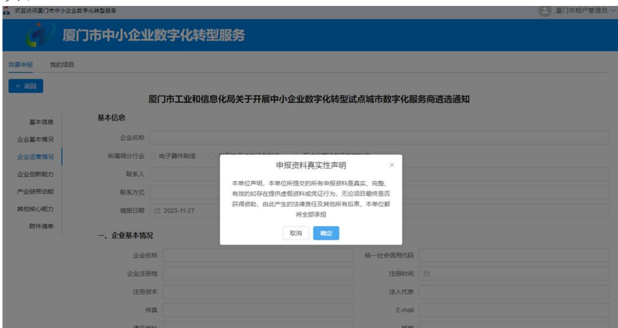
图8 申报资料真实性说明

(1) 申报材料真实性声明：企业针对申报资料真实性声明进行确认。点击确认后，进行材料填写。点击取消后，返回政策详情页面。