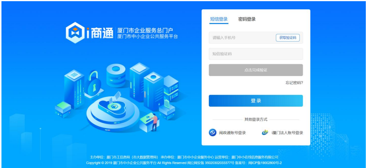
图5 登录页面进行注册/登录

3. 未注册的企业请注册企业账号（注意：需注册企业账号而非自然人账号），需在慧企云平台统一注册，通过后即可登录。