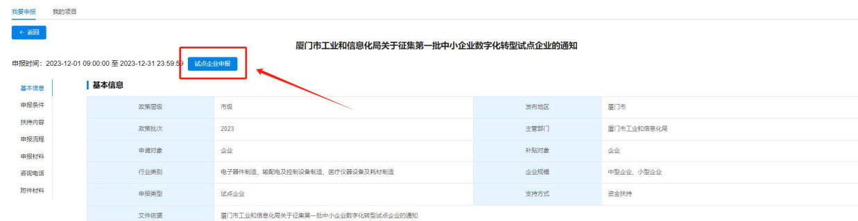
图7 试点企业申报入口

2. 点击试点企业申报，若企业已登录，会直接跳转至申报书填写页面。若企业未登录，企业登录后，跳转至申报书填写页面。